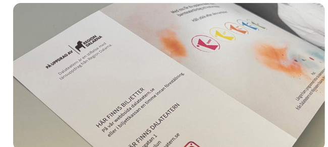
Insida i folder