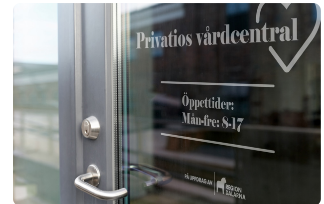
Placering på fönsterdekor