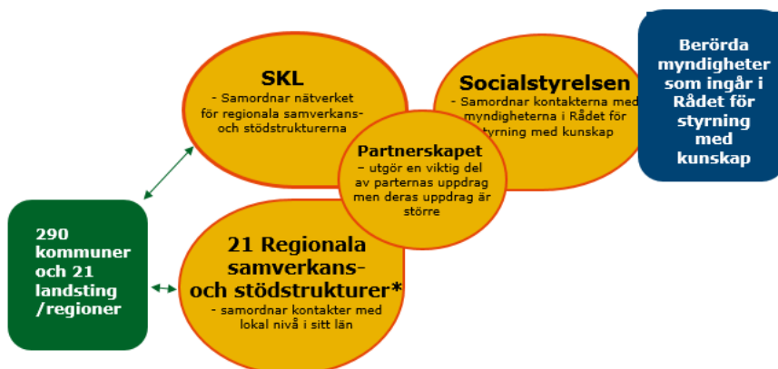
Bild 2. Illustration av partnerskapet som en del av parternas större uppdrag samt respektive parts samordningsansvar i relation till partnerskapet.

Nedan beskrivs respektive parts roll och åtagande i relation till partnerskapet.