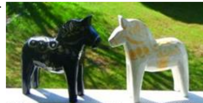
Dalarnas nätverk för psykisk hälsa