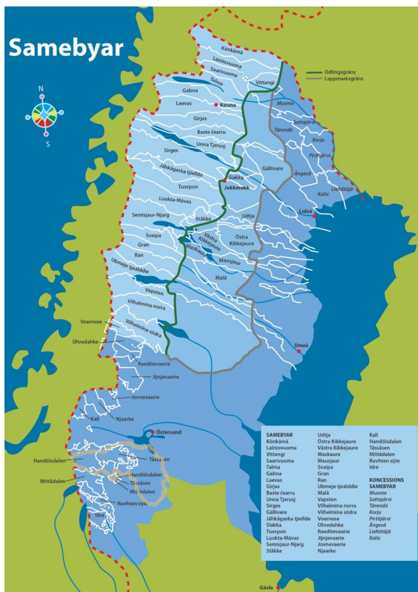
Figur 4: Karta över samebyar (Sunesson, 2017). Bergs kommun ungefärligt markerad i gult av Karolina Nätterlund.

Bergs kommun ingår i samiskt förvaltningsområde och överlappar geografiskt med fyra samebyar; Tossåsen, Handölsdalen, Mittådalen och Njarke (vinterbete). Samiska rådet i Bergs kommun har som uppgift att vara delaktigt i alla frågor som berör samerna i kommunen samt att verka som styr- eller referensgrupp vad gäller fördelning av kommunens del av det förstärkta skyddet för minoritetsspråket samiska. (Bergs kommun, 2021)