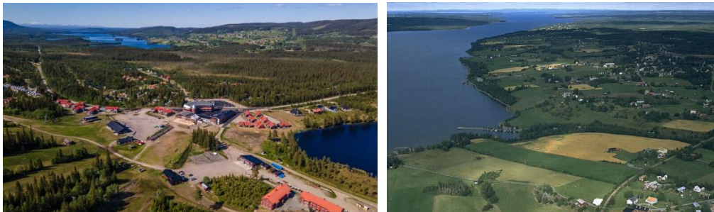
Figur 1: Klövsjöfjäll (Destination Vemdalen, 2020)